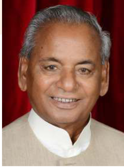
H. E. Kalyan Singh Chancellor

Tel. 0294-2470166, 2470707, Fax : 0294-2471150 E-mail : registrar@mlsu.ac.in Website : www.mlsu.ac.in